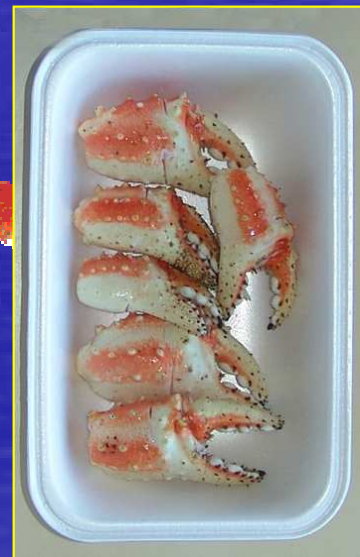
Pinces pré-sciées ( 210 à 250g )

Barquettes de Pinces pré-sciées ( 210 à 250 g )