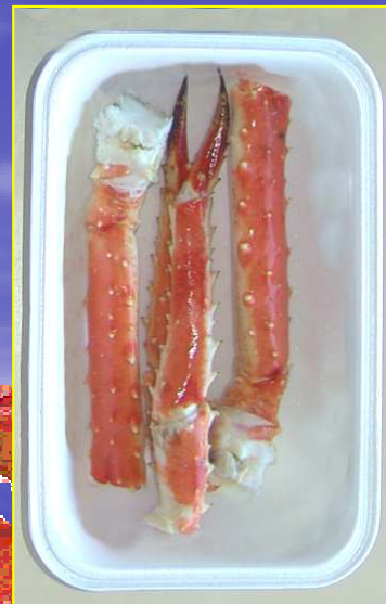
Pattes entières ( 220 à 250g )